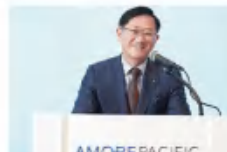
徐庆培 爱茉莉太平洋集团董事长