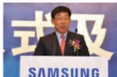
张元基 三星电子大中华区总裁