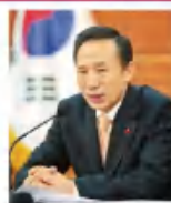
李明博 韩国前总统