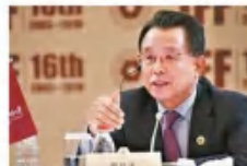
韩升洙 第56界联合国大会主席